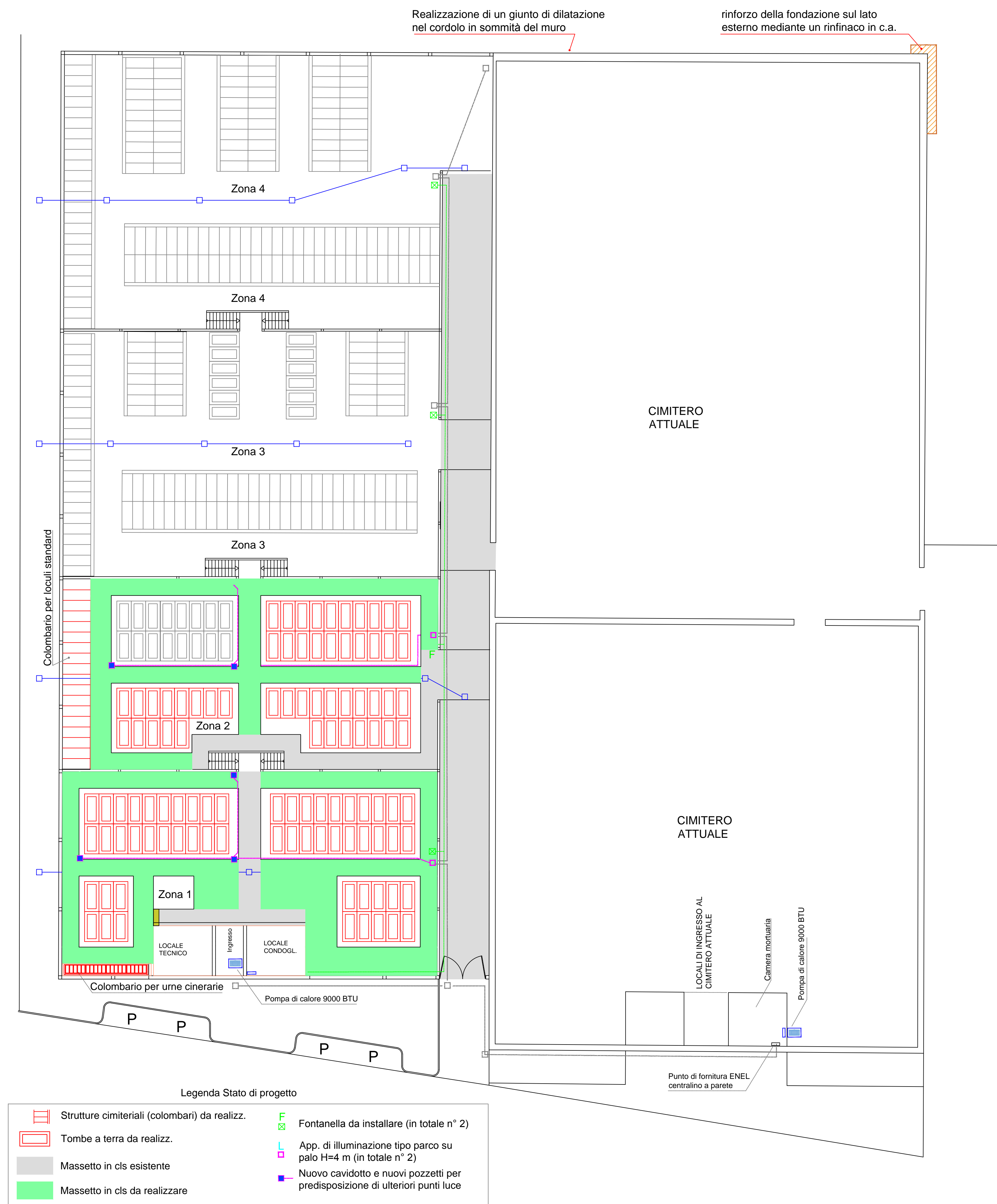
STATO DI PROGETTO Sc. 1:200