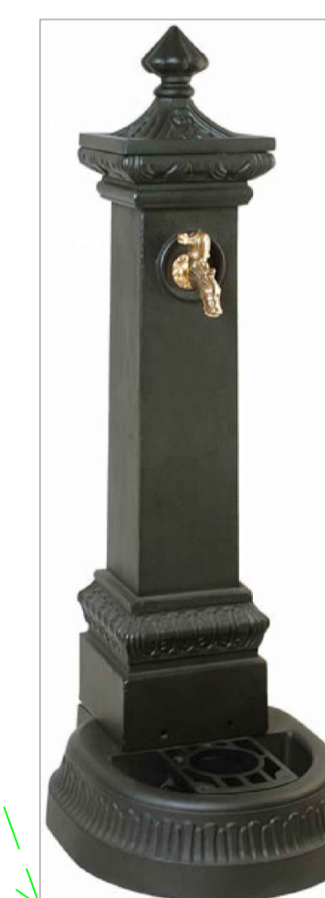
N° 2 fontanelle "tipo Milano" in ghisa grigia Colore grigio Altezza da terra >= cm 100 Peso >= kg 55 Compresa rubinetteria