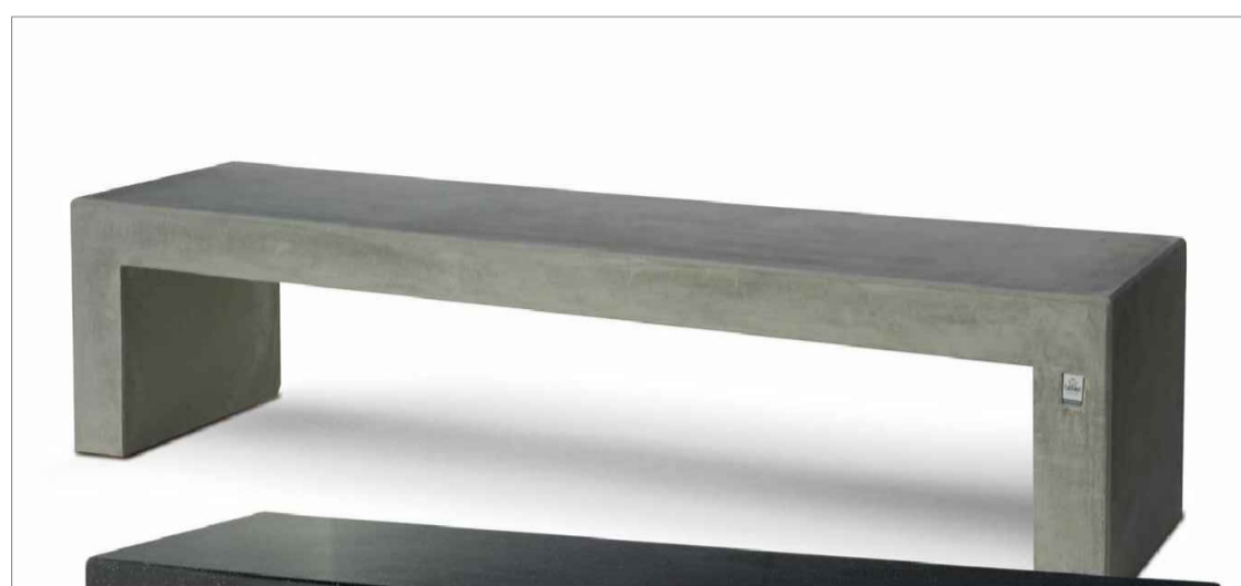
Panca in cemento armato monolitica, dimensioni cm 150x50xH50 colore bianco, superficie levigata