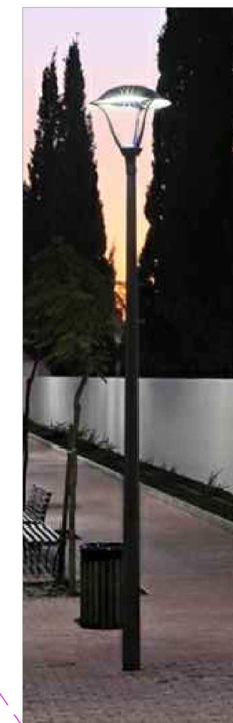
N° 2 apparecchi per illuminazione parco "Schröder ISLA LED" Assorbimento di potenza: 39W Corrente di funzionamento: 500 mA Flusso luminoso: 4.500 lm Temperatura di colore: 4000 K Colore apparecchio e palo: grigio Compreso ogni materiale per fissaggio a terra con tirafondi